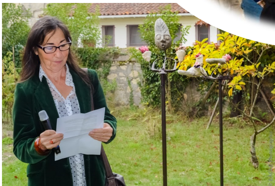
Le jardin des sens - Béatrice Hazard - Œuvre à demeure, jardin communal du presbytère - septembre 2017