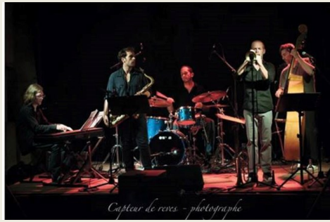
On Lee Way